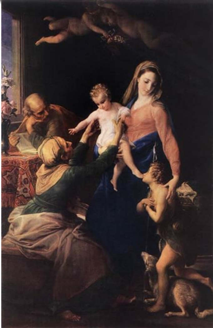
Batoni, pompeo sagrada familia 1777 the hermitage, san petesburgo

3.1. Exigencia de la “hora presente”: no es accesorio el cuidado de los niños, niñas y adolescentes.