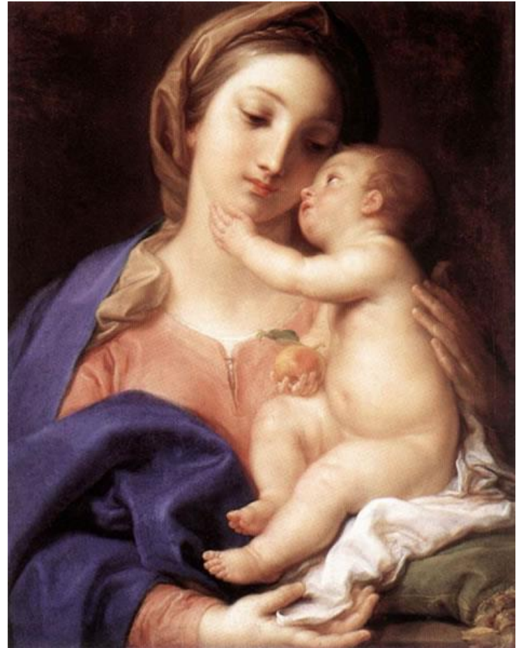
BATONI, Pompeo La Virgen y el Niño c. 1742 Galleria Borghese, Roma

Y abrazaba a los niños, y los bendecía poniendo las manos sobre ellos.