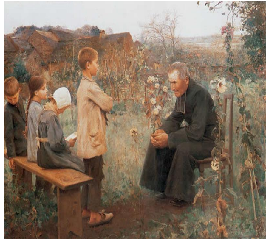
MUENIER, Jules-Alexis La lección de catecismo 1890