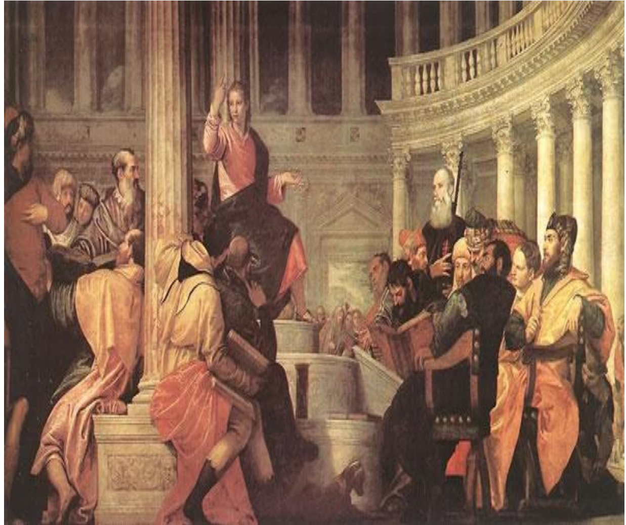
VERONESE, Paolo Jesús entre los doctores del templo 1558 Museo del Prado, Madrid