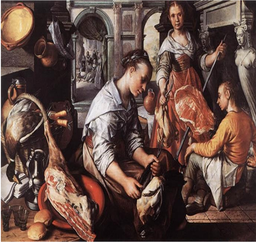
BEUCKELAER, Joachim Cristo en casa de Marta y María 1565