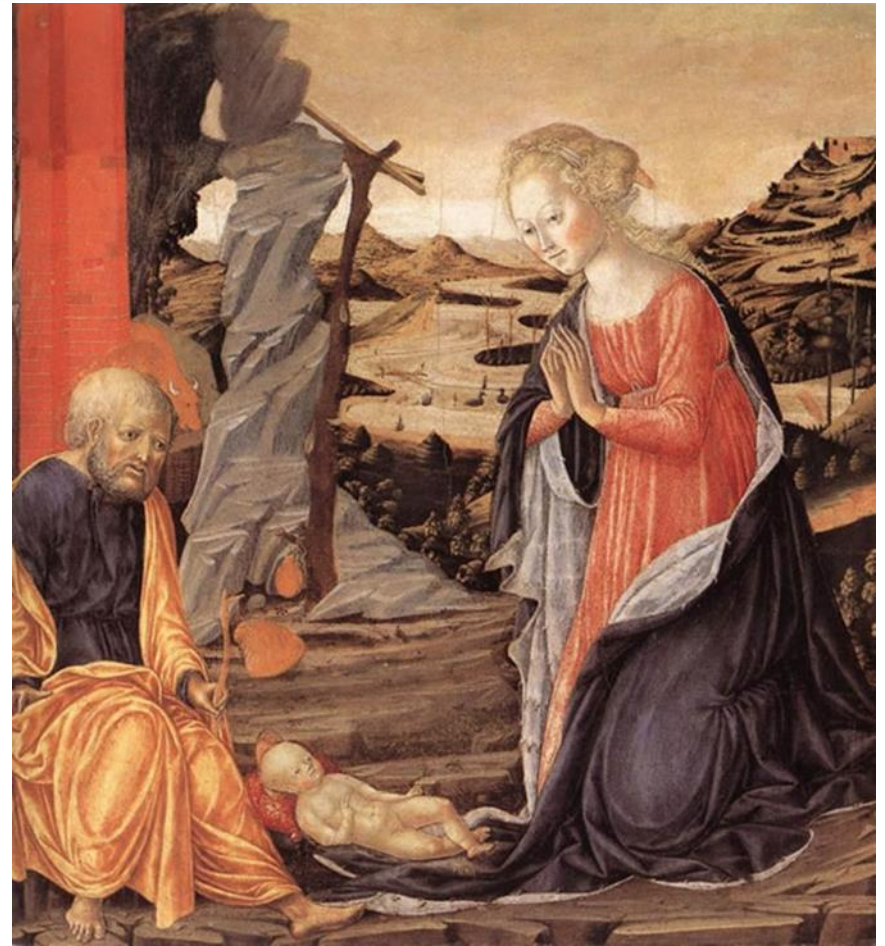
FRANCESCO DI GIORGIO MARTINI Natividad c. 1470

“La herencia del Señor son los hijos, su recompensa es el fruto de las entrañas”