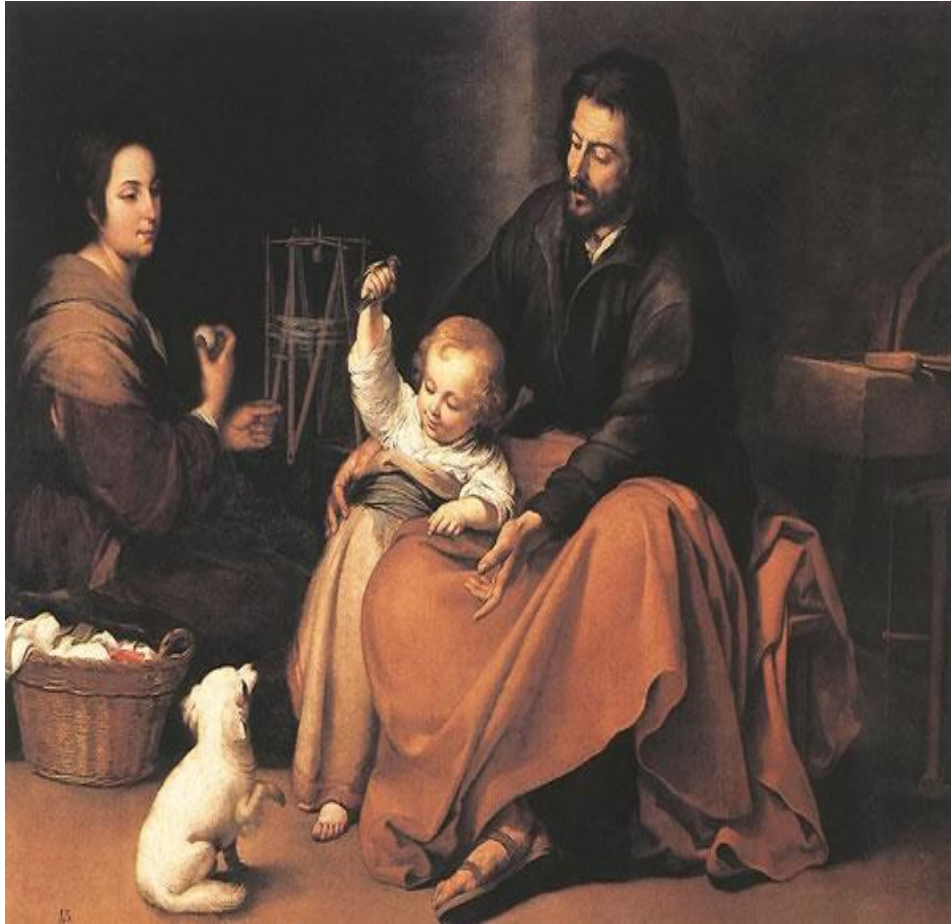
MURILLO, Bartolomé Esteban La Sagrada Familia del pajarito 1650 Museo del Prado, Madrid